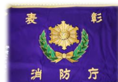
消防庁長官表彰旗受章