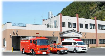
東秩父分署新庁舎完成