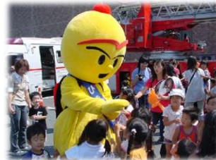
ひきまる（ちびっこまつり）