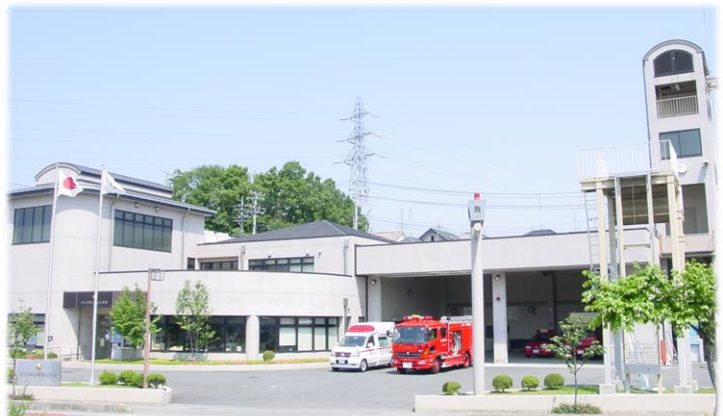
嵐山分署新庁舎完成