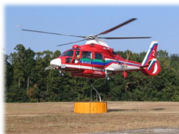
山林火災防ぎょ訓練