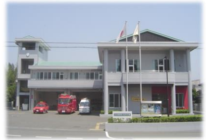
ときたま分署新庁舎完成

4月 1日 第4代消防長に安野泰治氏が就任する。 8月20日 仮称、小川消防署都幾川・玉川分署新庁舎完成（鉄筋コンクリート造2階一部4階建、延べ面積999.90㎡）職員20名、水槽付消防ポンプ車1台、救急車1台、連絡車1台をそれぞれ配備し、名称を小川消防署ときたま分署として、業務を開始した。