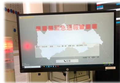
Net119 緊急通報システム導入