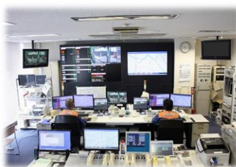
消防緊急指令施設更新