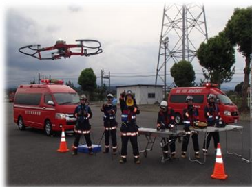
無人航空機ドローン配備