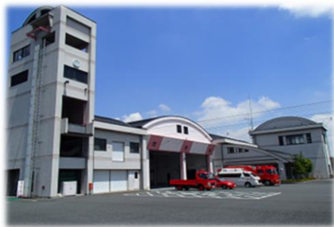
吉見分署新庁舎完成