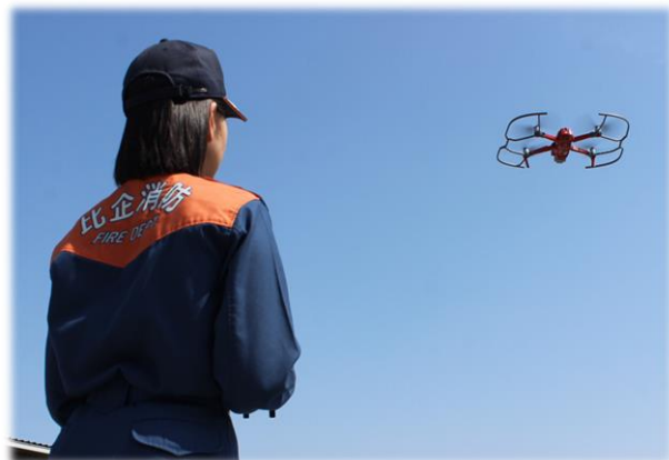
ドローン運用アドバイザー認定