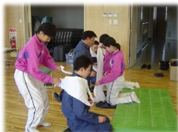
中学生チャレンジ事業