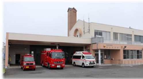
松山北分署大規模改修工事完了