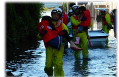
台風19号による災害救助活動