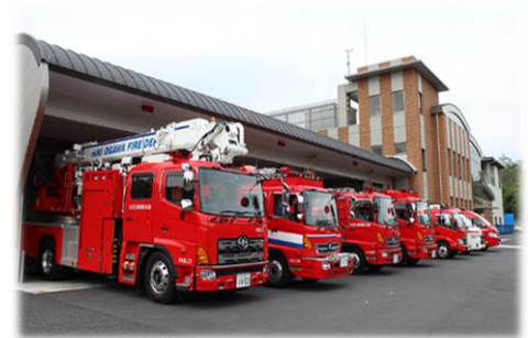
小川消防署新庁舎完成