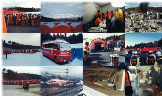
東日本大震災 緊急消防援助隊派遣