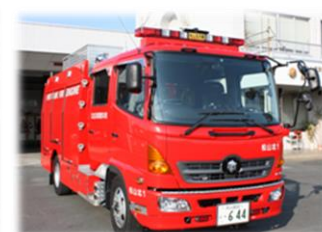
消防緊急通信指令施設改修