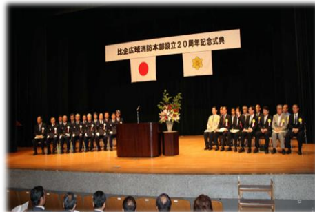
設立20周年式典開催