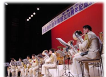
音楽隊設立30周年記念演奏会