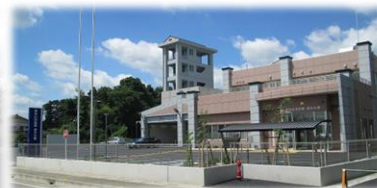
滑川分署新庁舎完成