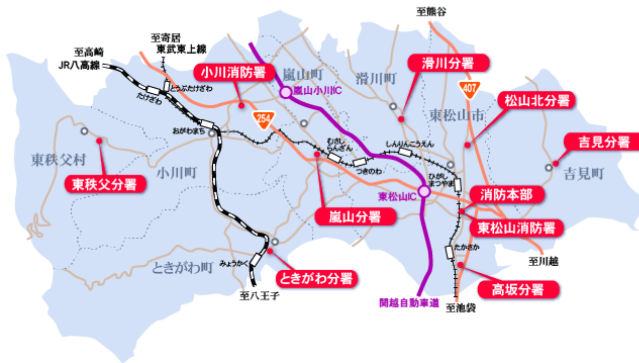
管内の面積・人口・世帯