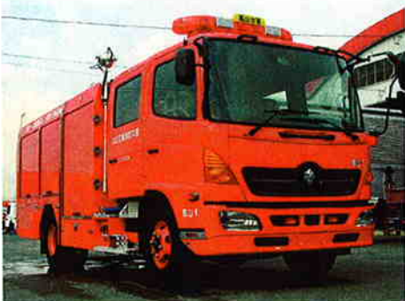
化学車・平成16年2月20日納車