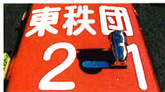
県内初、消防団車両の対空表示