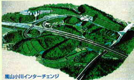
嵐山小川インターチェンジ

待望の関越自動車道「嵐山小川インターチェンジ」が、いよいよ来る3月27日(土)午後3時に開通します。このインターチェンジは、東松山IC～花園IC(16.7km)のほぼ中間の嵐山町大字杉山に位置し、東松山ICや花園ICと同様な型の入口2レーン、出口4レーンの上下線に乗り降りできる一般的なものです。また、インターチェンジのアクセス道路は、県道熊谷小川秩父線のバイパスとして県道深谷嵐山線から国道254号バイパスまでの約2.8kmで、この道路は暫定2車線での開通となります。